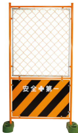
ガードフェンス トラ(ハーフ) 900×1800mm 6.2kg B-738 B-738-01