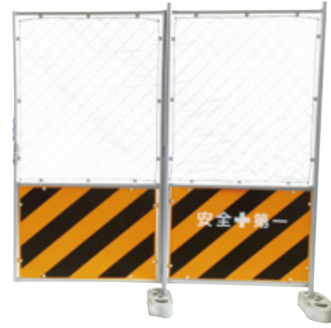
NEO クグらず通れる扉フェンス