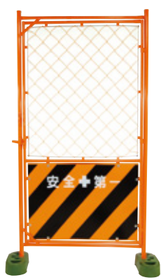
扉付ガードフェンス トラ(ハーフ) 900×1800mm 9.4kg B-601 B-601-01