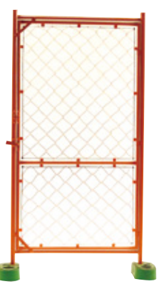
扉付ガードフェンス オールネット(ハーフ) 900×1800mm 9.4kg B-6013 B-6013-01