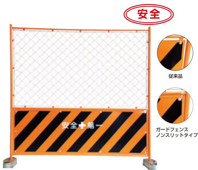
ガードフェンス ノンスリット 1800×1800mm 8kg B-037