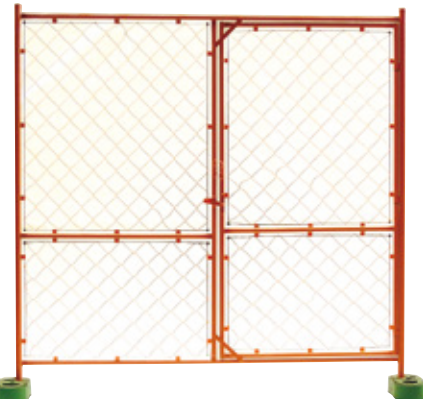
扉付ガードフェンス オールネット 1800×1800mm 12kg B-6003 B-6003-01