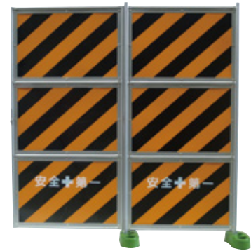
NEO NEO シルバーガードフェンス トラ ノンスリットタイプ