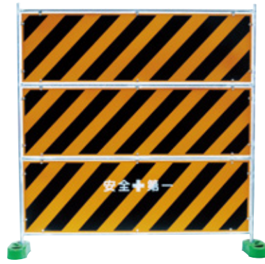
NEO NEO シルバー3段フェンス トラ