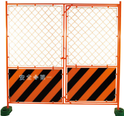
扉付ガードフェンス トラ 1800×1800mm 12kg B-600 B-600-01