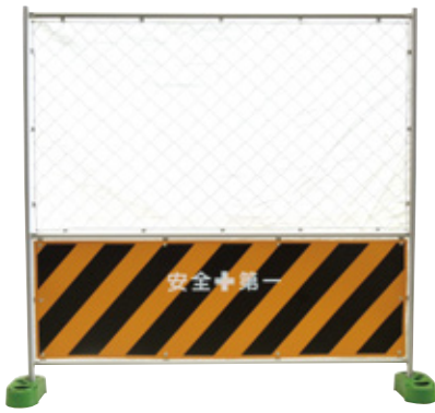
NEO NEO シルバーガードフェンス トラ