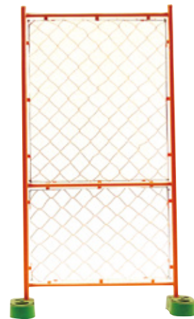
ガードフェンス オールネット(ハーフ) 900×1800mm 6.2kg B-7383 B-7383-01