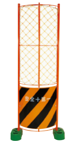
電柱用丸型フェンス トラ 575×1800mm 5.2kg B-739 B-739-01